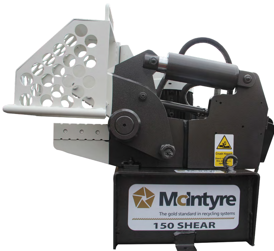
CROCO-150 Petite, puissante, précise !

L'ouverture et la fermeture des mâchoires sont commandées par pédale. Pour garantir la sécurité de l'opérateur, les lames reviennent immédiatement en position ouverte lorsque la pédale n'est plus actionnée. La commande par câble, donne une grande précision dans la coupe : positionnez la lame au millimètre près !