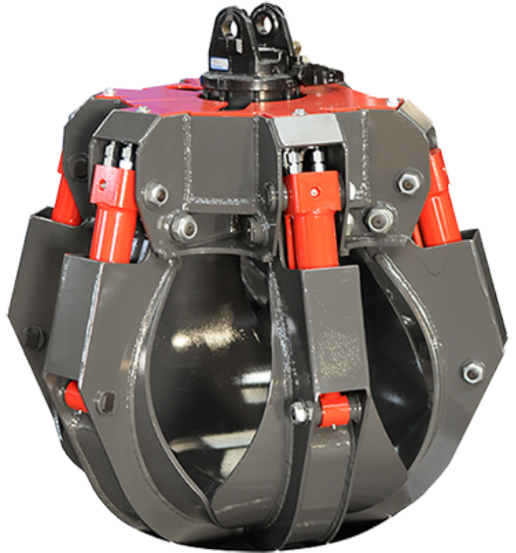
Grappin STAR-Z 250