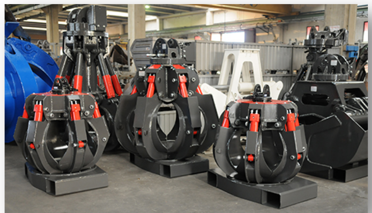
MINELLI : une gamme de grappins de 120L jusqu'à 750L.